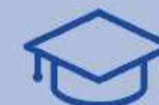
Cursos em EaD