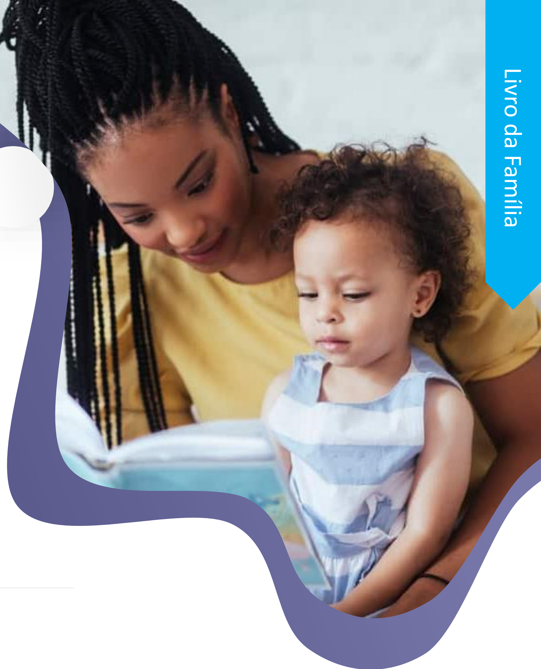
Livro da Família