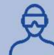
Realidade virtual e aumentada